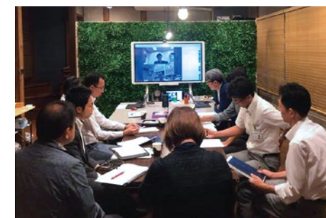
UDC信州事業推進会議の様子