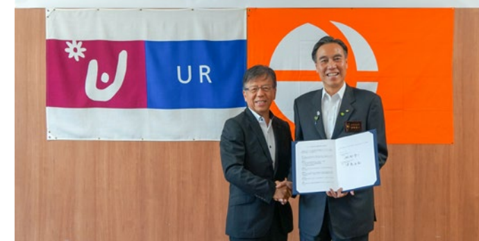
協定調印式の様子