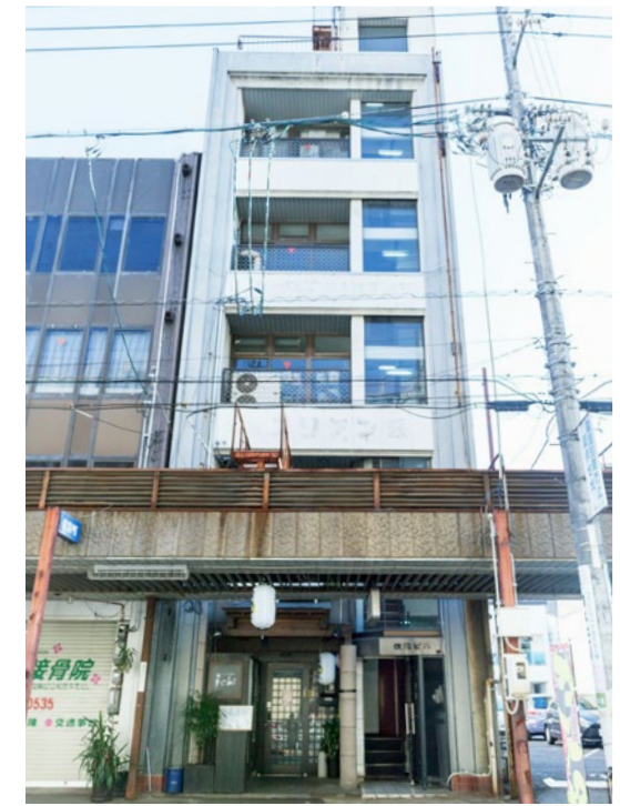
リノベーション物件の外観