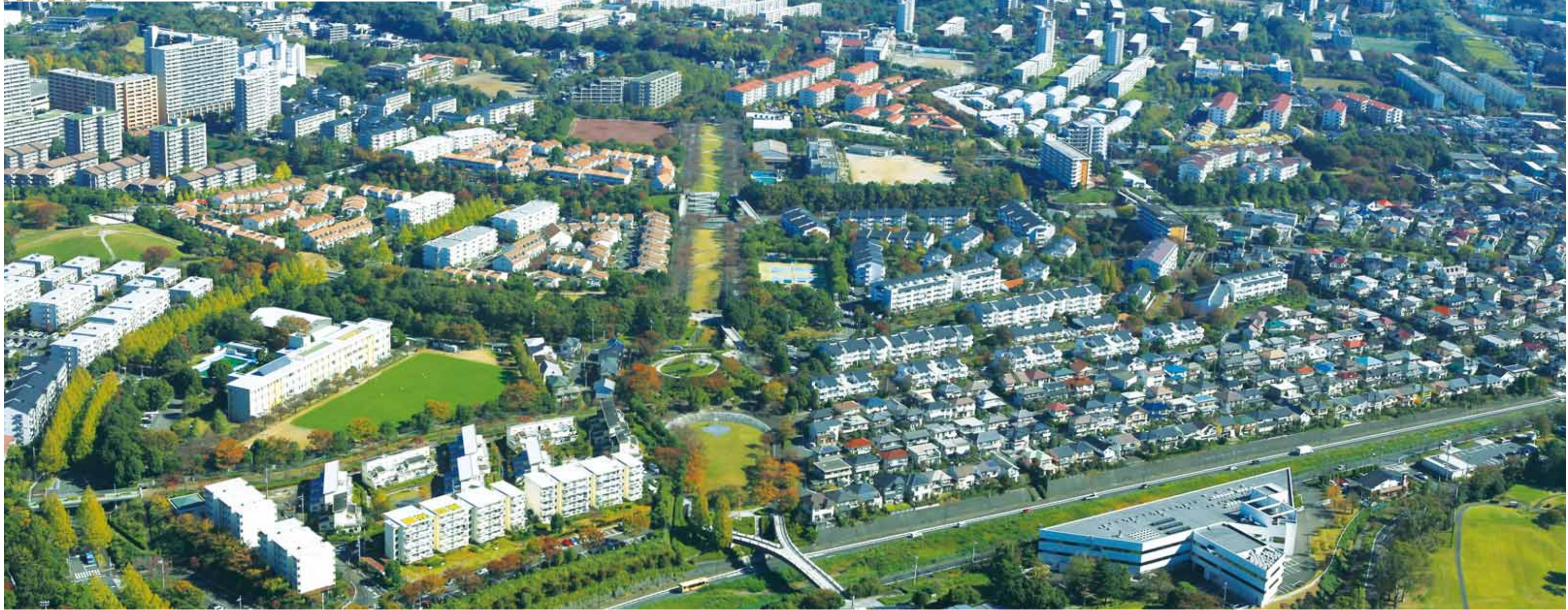
多摩ニュータウン 鶴牧・落合地区

多摩ニュータウンは、高度経済成長期の東京で深刻化していた、人口・産業の都市圏一極集中による住宅不足と都市のスプロール化に対処するため、都心から20~30km離れた多摩地域に、計画的住宅市街地形成と良質な住宅の大量供給を目的として1965年から建設がスタートした日本最大規模(約2,900ha)のニュータウン開発事業。UR都市機構はマスタープラン策定や約1,400haの新住宅市街地開発事業の施行、住宅供給などを行いました。現在、約9万世帯・人口約22万人が生活する都市へと成長しています。