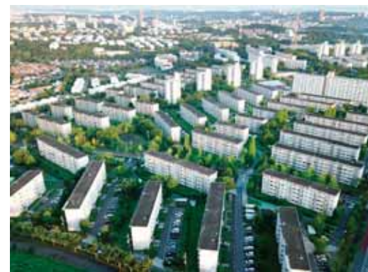
UR都市機構が建設・管理する緑豊かな賃貸住宅団地のひとつ(永山団地、管理戸数3253戸)