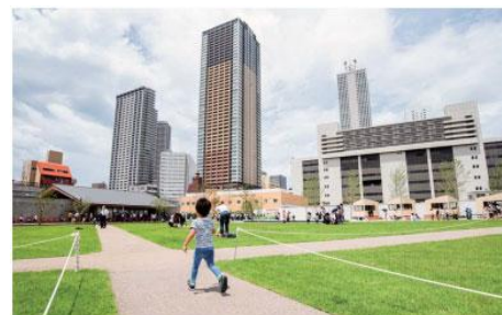
としまどりの防災公園（IKE・SUNPARK）（豊島区）