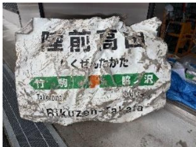
津波被害の甚大さが伺える駅看板（陸前高田市）