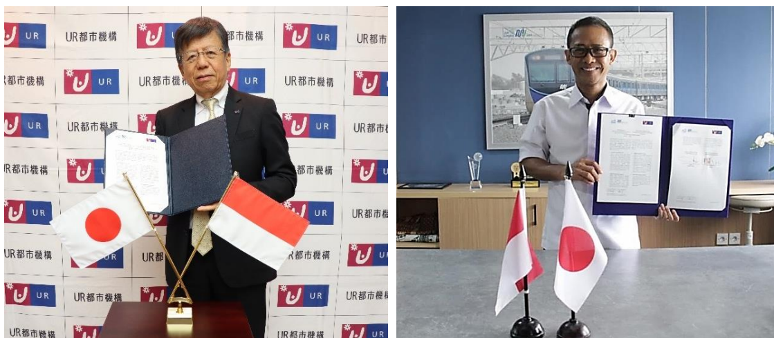
覚書署名時の様子

本覚書に基づく連携を通じて、ジャカルタ首都圏における TOD プロジェクトへの日本企業の参画機会創出を図って参ります。