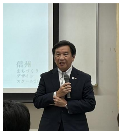
開校式で挨拶を述べる石田UR都市機構理事長