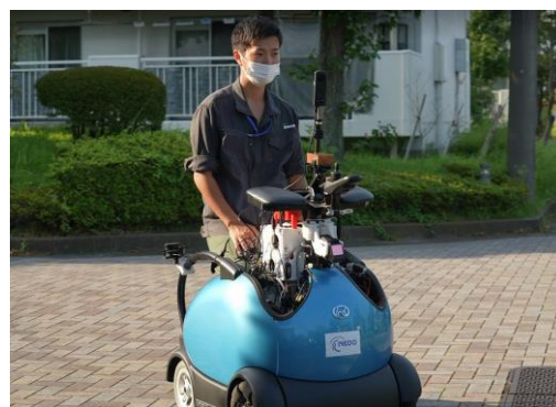
<モード切り替えのイメージ>