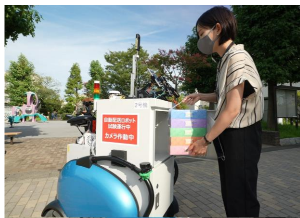
<自動配送ロボットのイメージ>

UR都市機構では、5GやAI・IoTなどのスマート技術の活用により、社会課題の解決やUR賃貸住宅の魅力向上をめざして研究してまいります。（別紙2）