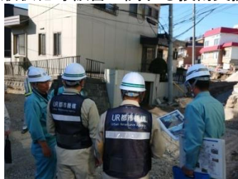
【平成 30 年北海道胆振東部地震】