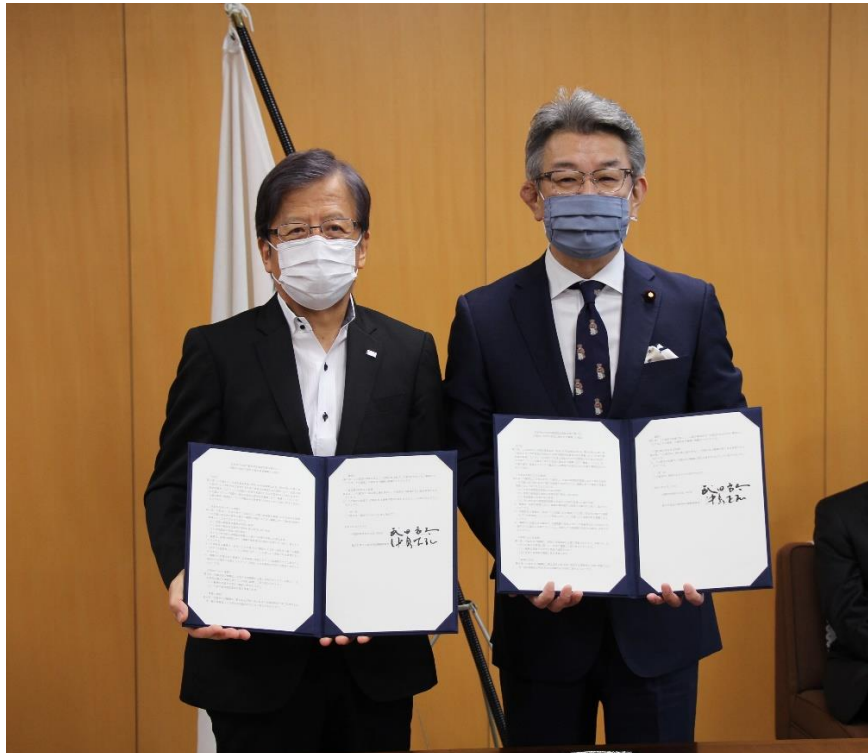
写真左より、中島UR都市機構理事長、武田内閣府特命担当大臣（防災）

住家の被害認定：地震や風水害等の災害により被災した住家の被害の程度を認定すること。この認定を基に、被災者生活再建支援金をはじめとした各種被災者支援策の判断材料となる罹災証明書が交付される。