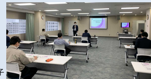
内閣府講師による住家の被害認定に係る研修の様子