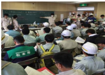
【平成 28 年熊本地震】