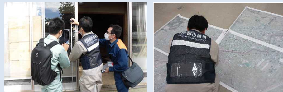
住家の被害認定調査業務に関する支援の様子