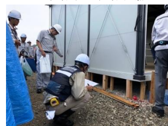
【平成 30 年 7 月豪雨】