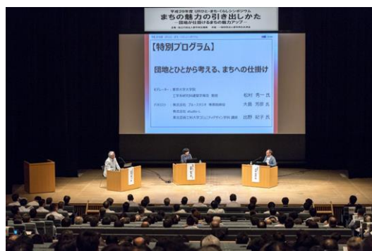
（写真は昨年度の様子）

OURでは、「URひと・まち・くらしシンポジウム（UR技術・研究報告会）」を毎年開催しています。有識者をお招きした講演や、URが取り組む事業・技術研究の報告等を通じて、社会的課題を踏まえたこれからの時代のまちづくりや、新たな暮らし方などを考えます。