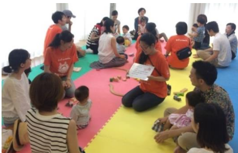
参考：イベント時の交流の様子