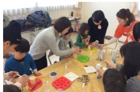
参考：制作時の様子