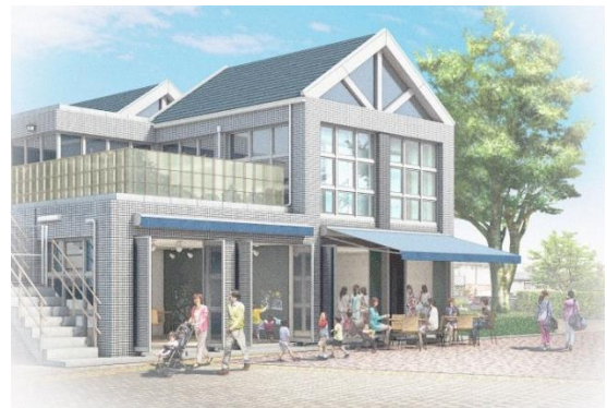
<改修後外観イメージ>