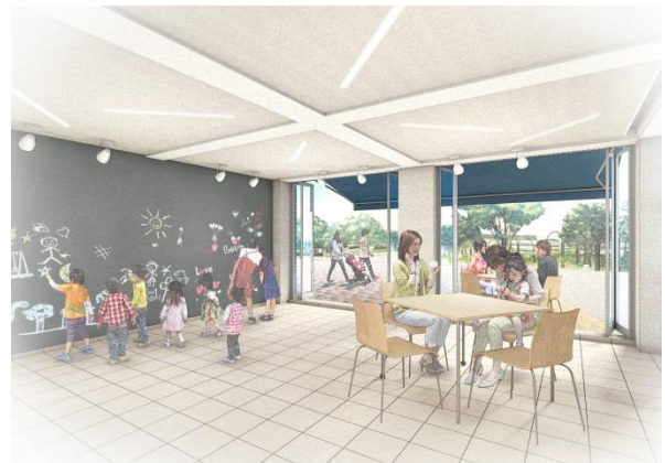
<改修後多目的室イメージ>