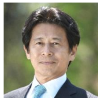
かげじ のぶよし 影治 信良 氏 徳島県美波町 町長