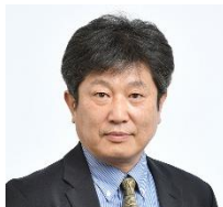
東京大学 生産技術研究所 教授

○パネルディスカッション 「防災とまちづくり」に関する取組み事例を紹介するとともに、実践するうえで重要となるポイント等を議論します。