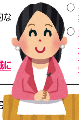
シニア アドバイザー (相談員)