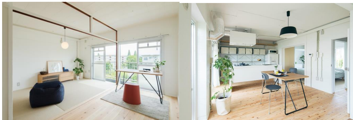
（大阪府富田林市 金剛）

「MUJI × UR」の新プラン発表に際して、モデルルームの記者向け内覧を受け付けています。新プラン住戸のご取材をご希望される場合は、UR都市機構までお問い合わせください。ご多忙の折とは存じますが、何卒ご取材賜りますようお願い申し上げます。