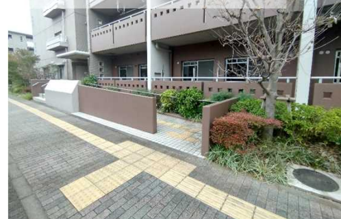
③ エントランスマスロープ