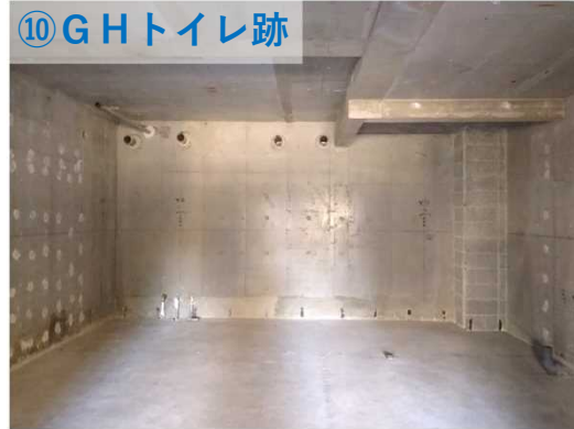
⑩ G H トイレ跡