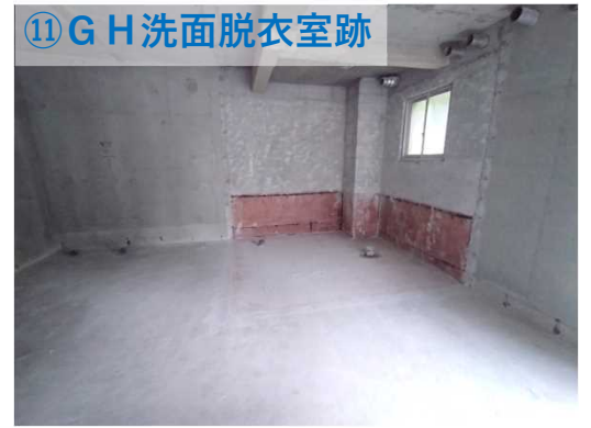
⑪ G H 洗面脱衣室跡