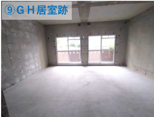
⑨ G H 居室跡