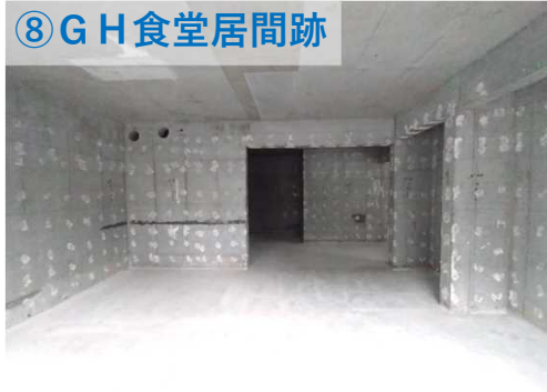
⑧ G H 食堂居間跡