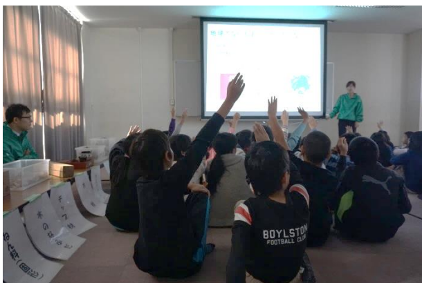
手を挙げてクイズに答える児童たち