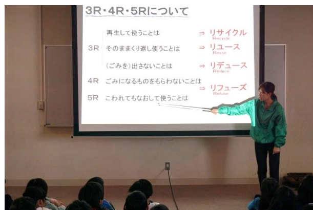
3 R ・ 4 R ・ 5 R の説明