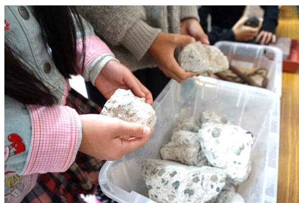
展示コーナーでの様子