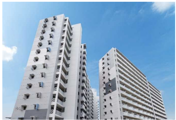
<102号棟及び103号棟外観>