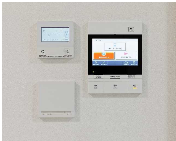
<オートドアロックシステム>

また、光回線を利用したインターネット配線設備を完備し、別途契約（有料）が必要となりますが、各住宅にインターネット用コンセントを設置しています。