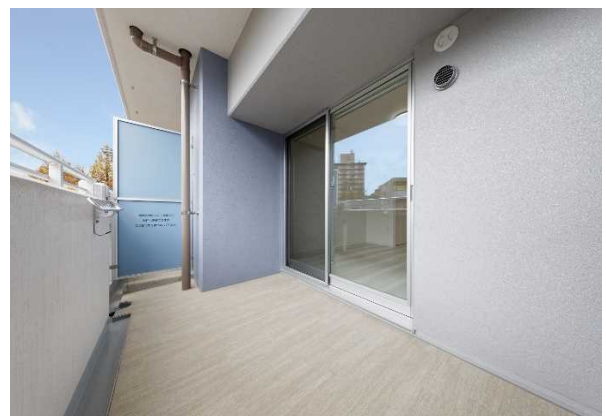
<出幅1.9メートルの広々としたバルコニー>