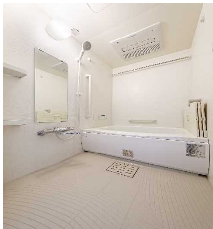
<浴室乾燥機付き浴室>