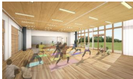
多目的スタジオ（イメージ図）