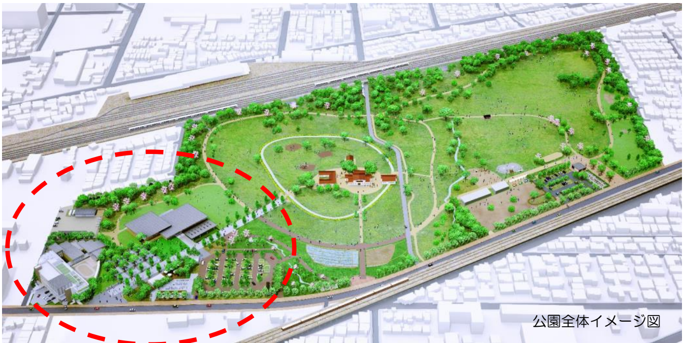
公園全体イメージ図