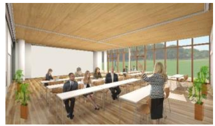
多目的室（イメージ図）