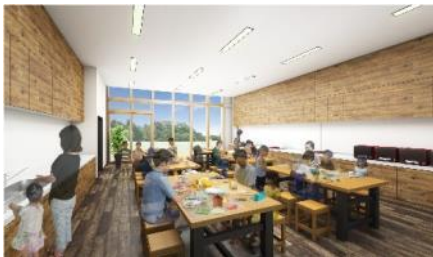
工作・調理室（イメージ図）