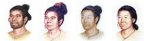
石井礼子 作