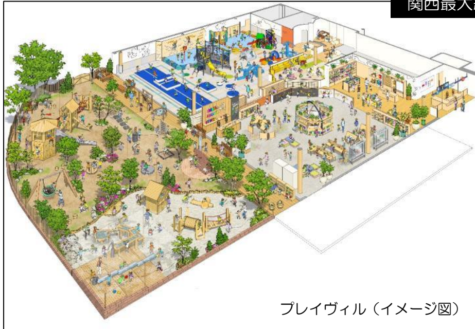
プレイヴィル（イメージ図）