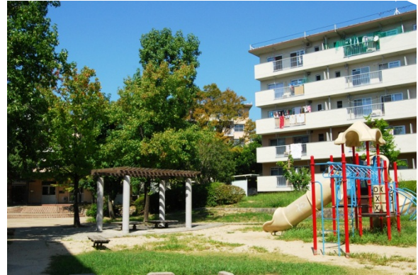
男山（京都府八幡市）

なお、本件は当機構本社（横浜市）から、国土交通省記者会にも同時発表しております。