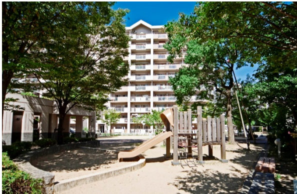
アルビス旭ヶ丘（大阪府豊中市）