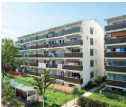
グリーントウン榎島