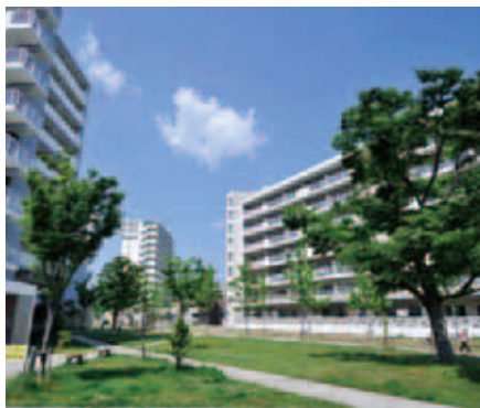
パークタウン西武庫