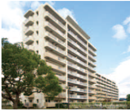
サンヴァリエ金岡