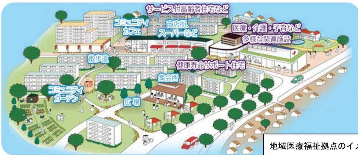
地域医療福祉拠点のイメージ