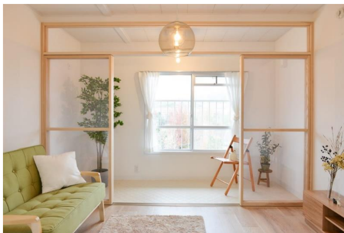
インナーバルコニーのある暮らし（Style2019）