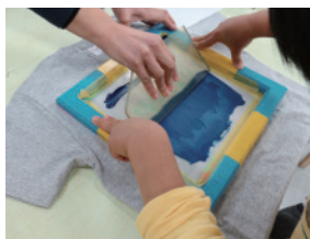
シルクスクリーンプリントイメージ