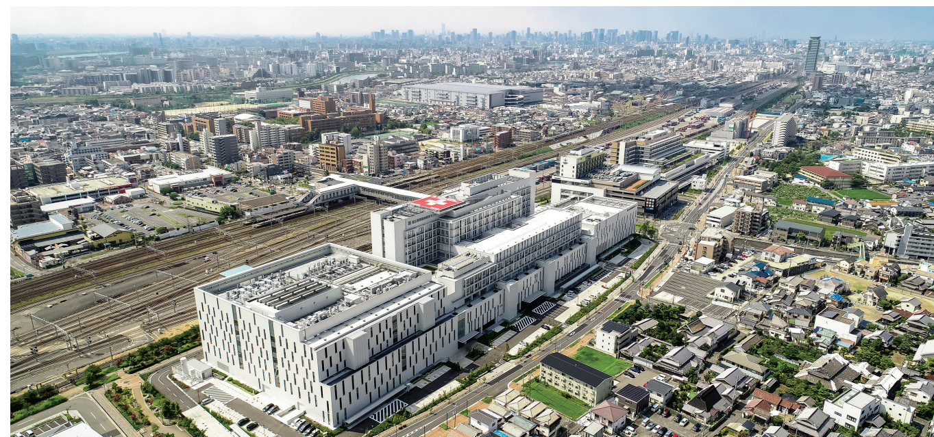
北大阪健康医療都市

1923年に開業した吹田操車場は、約50haの規模を誇り、「東洋一の操車場」と名を馳せましたが、貨物輸送の合理化によって1984年にその役割を終え、新たなまちづくりが進められることになりました。当地区では「緑と水につつまれた健康・教育創生拠点」の創出をコンセプトに、医療健康及び教育文化創生ゾーンを中核として、都市型居住ゾーン、緑のふれあい交流創生ゾーンをバランスよく配置、URは土地区画整理事業による基盤整備や防災公園の整備、民間事業者の誘導を担いました。そして当地区は「北大阪健康医療都市～愛称：健都(けんと)～」として新しく生まれ変わりました。