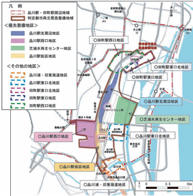
※優先整備地区の指定及び区域は、周辺状況を踏まえ、適宜見直しを図る。 ※出典：東京都都市整備局都市づくり政策部開発企画課 品川駅・田町駅周辺まちづくりガイドライン2020