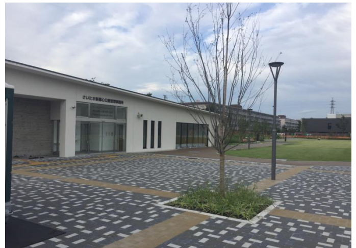
賑わい広場・管理棟