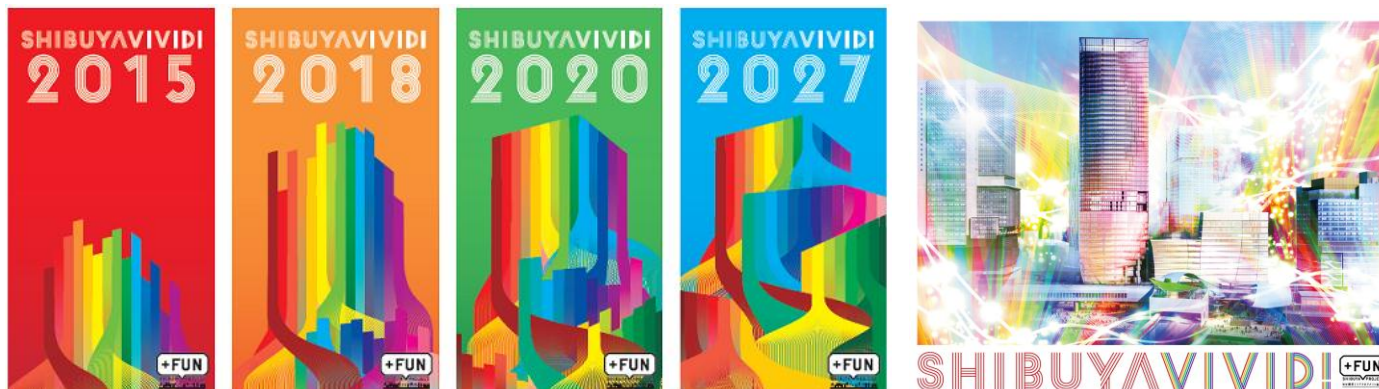
※図はイメージです