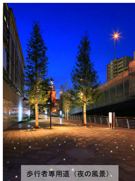
歩行者専用道（夜の風景）