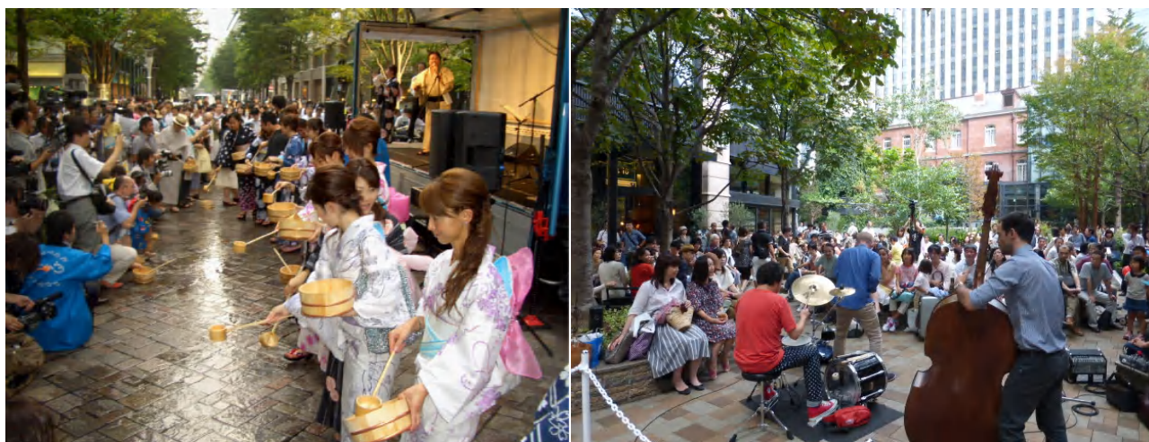
↑ イベントイメージ

一方、近年再開発の進む大手町地区では、丸の内仲通りの機能延伸部として、各地権者が空地を提供するだけでなく、通りに面した店舗を配し、並木を整備し、ベンチ等憩いのスペースを提供しています。歩行者専用道は、この仲通りの機能延伸部とほぼ中央で連結する為、延伸部分を保有する各地権者と連携し、季節を感じ、スポーツを楽しみ、食を堪能し、文化に触れるイベント、時には丸の内仲通りと一体でのイベント開催も検討中であるほか、バナーフラッグやポスターによる商業広告の掲示を行い、今後の大手町地区の賑わいだけでなく丸の内、有楽町地区も含めたエリア全体の活性化に寄与し、更に人々が集まる大手町を目指します。