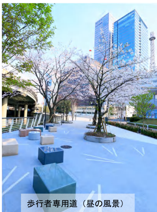
歩行者専用道（昼の風景）

※ 3 エリアマネジメント＝地域における良好な環境や地域の価値を維持・向上させるための、住民・事業主・地権者等による主体的な取り組み（国土交通省 定義）