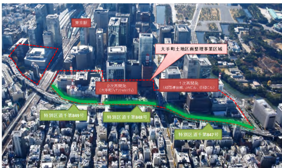
大手町地区及び歩行者専用道 位置図