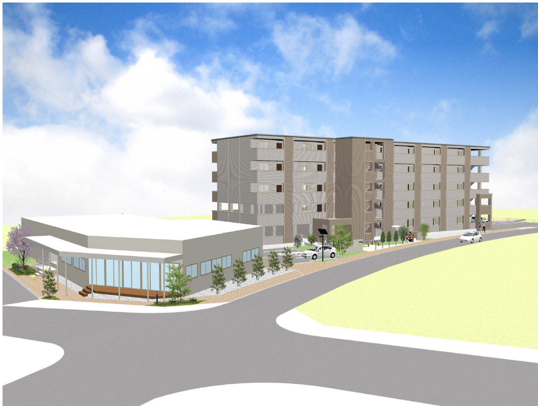
地区北西交差点側（国道 45 号線側）より望む