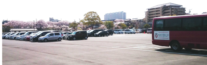
国宝犬山城を訪れる観光客のための駐車場。災害発生時には防災公園とともに避難場所等として機能