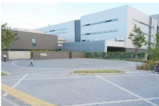
隣接する造幣局との舗装デザインの統一による一体的な景観形成

緊急車両の乗入れが可能で、透水性・保水性機能によるヒートアイランド現象緩和と雨水涵養・貯留に寄与している