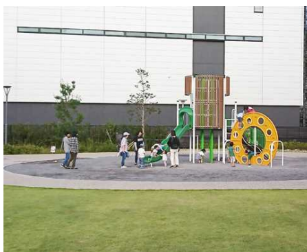
隣接する造幣局にちなんだ硬貨をモチーフとした遊具