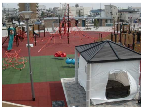
非常時にテント機能をもつ防災パーゴラ