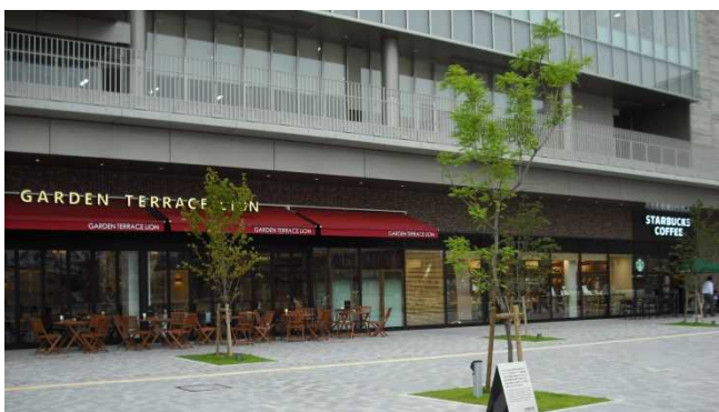
市街地部分の店舗による賑わい