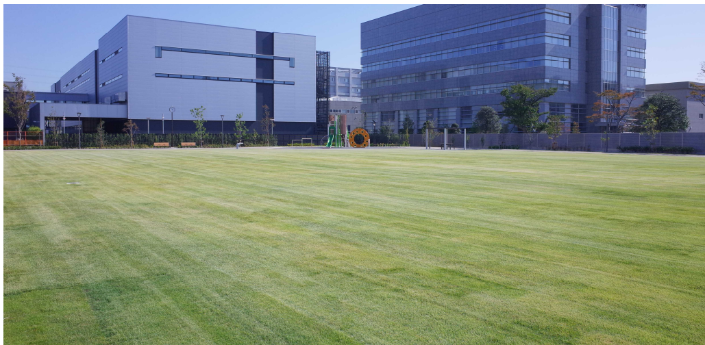
開放的で空間的な広がりを感じることができ、平常時は憩いの場として利用されている芝生広場

緊急車両の乗入れが可能で、透水性・保水性機能によるヒートアイランド現象緩和と雨水涵養・貯留に寄与している