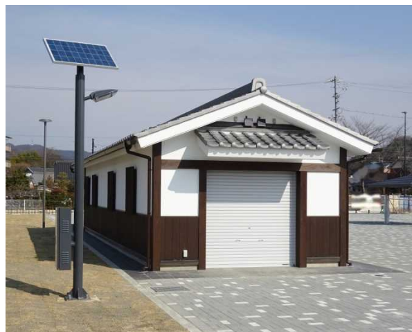
城下町の歴史的風致の維持向上のため、公園内の防災備蓄倉庫（トイレ合築）の屋根や壁面のデザインに留意し、景観形成に配慮