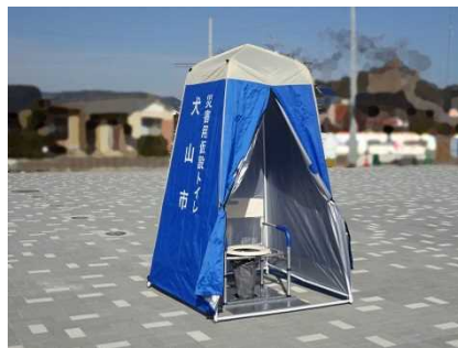
マンホールトイレ