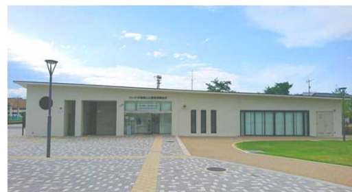
地域の方が利用できる多目的スペースを備えた管理棟