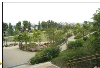
高低差を緑地・スロープで処理