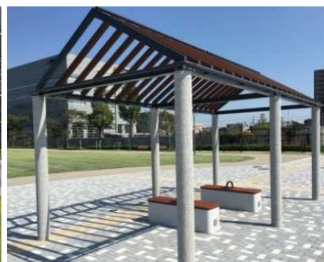
災害時には仮設テントとして利用できる防災パーゴラ