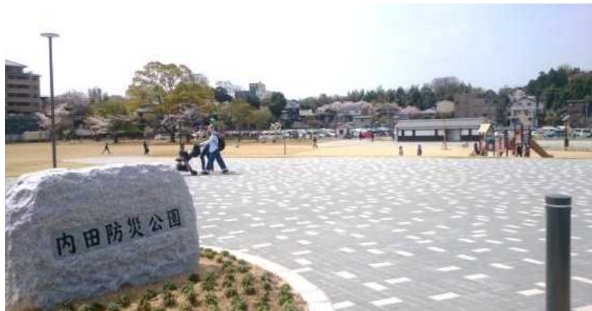
平常時は市民の憩いや運動の場として、災害発生時には避難場所としての機能を持つ防災公園