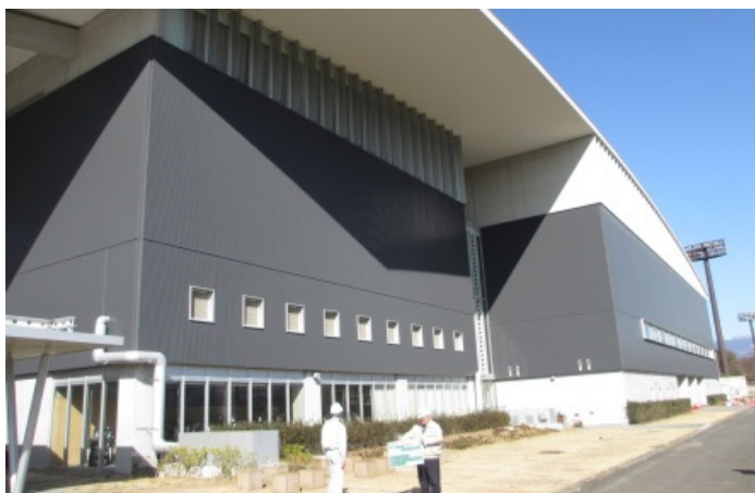
◆改修された総合体育館の外観

なお、本公園の体育館等は、新設の際にURが受託して整備した施設であり、過去に受託した施設のフォローアップ等も随時行っています。