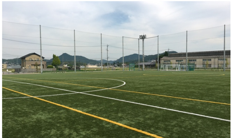
◆人工芝による多目的スポーツ広場