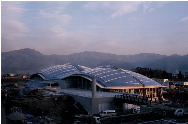
◆体育館・プール棟