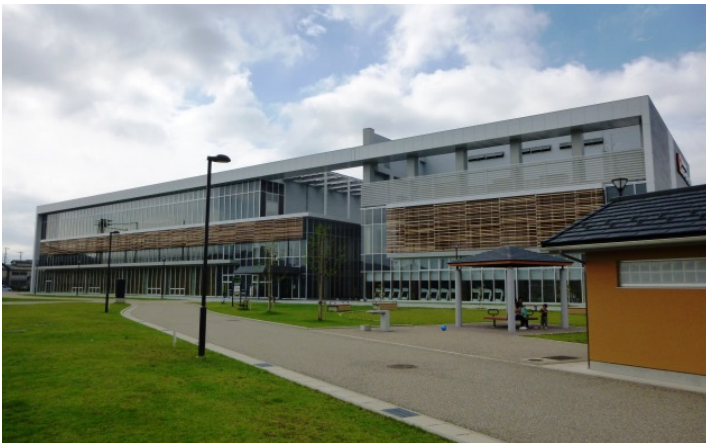
◆新設された体育館（エネルギーサポートアリーナ）

体育館には、メインアリーナ、サブアリーナ、多目的室、トレーニングルーム、親子ふれあいルーム等があり、屋外の多目的スポーツ広場と併せて、子どもから大人までさまざまな目的で利用することが出来る公園となっています。