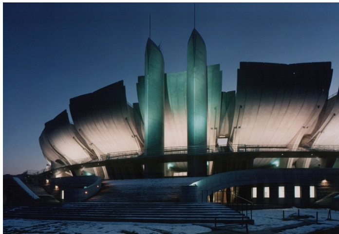
◆多目的競技場（長野オリンピックスタジアム）

既存野球場の老朽化と第18回長野冬季五輪を契機として、多目的競技場や体育館・プール棟等の整備を実施しました。多目的競技場は長野冬季五輪の開会式・閉会式の会場として使用され、「さくらの花弁」をモチーフとした印象的な外観をしています。五輪終了後の改修を経て、現在は野球場として利用されています。体育館・プール棟は、五輪開催期間中は選手のトレーニングや各メディアの拠点として活用されました。