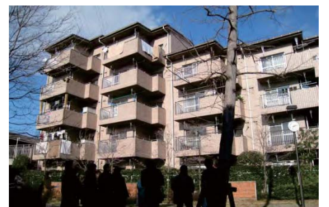
コミュニティ住宅(事業協力者のための区営の賃貸住宅。地区内に7棟68戸整備されており、地域開放型の集会所を備えたものや、エレベーター付のものもある。)