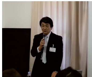
関原一丁目地区の整備実績