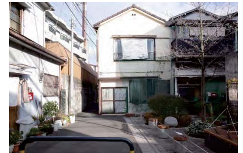
道路拡幅の様子(商店街と区道の角地。元々狭かった通路が、セツバックして拡幅された様子がわかる。)