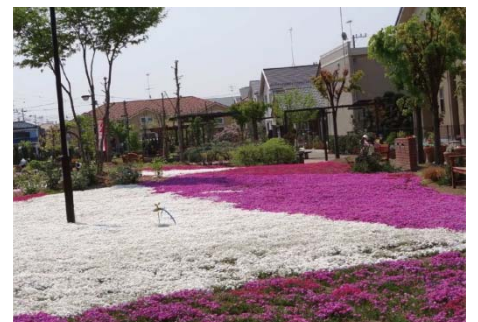
すみれ野中央公園の 4 月の様子。 芝桜が見ごろになる。

一瀬氏：北鴻巣駅ができた時期から 30 年弱、すみれ野地区の近隣に居住。定年退職後に NPO の事務局長となり、3 年以上活動に取り組んでいる。