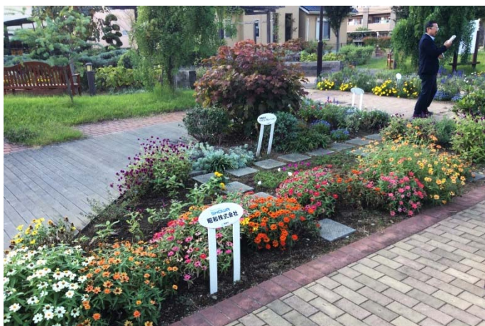
すみれ野中央公園に設けられたスポンサー花壇