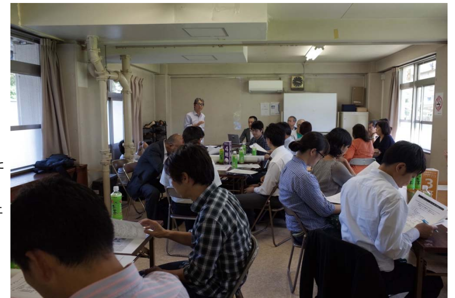
地域資源掘りおこしワークショップ