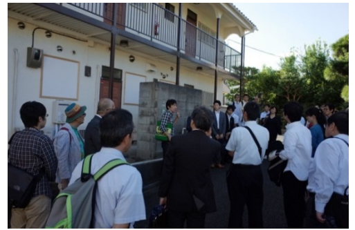
タガヤセ大蔵外観。デイサービスだが、「自宅の暮らしの延長」ということで、完全なパリアフリーにはしていない。