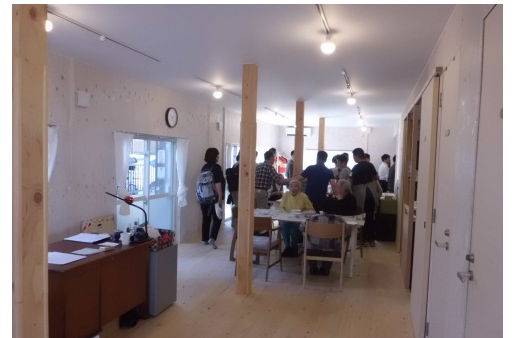
タガヤセ大蔵内部の様子。一般の人と高齢者との間に壁を立てるデイサービスの決まりに対し、多世代交流可能なように一般の訪問者を「ボランティア」扱いにして壁をなくした。