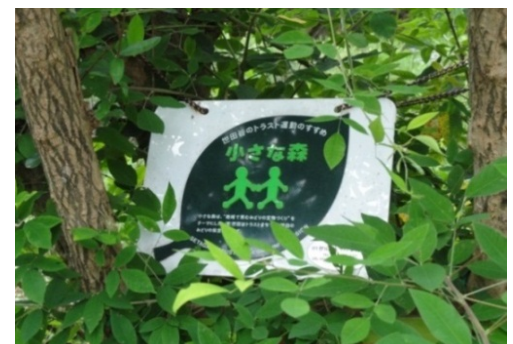
「小さな森」の小さなプレート。オープンガーデンの日には軒先に出される。