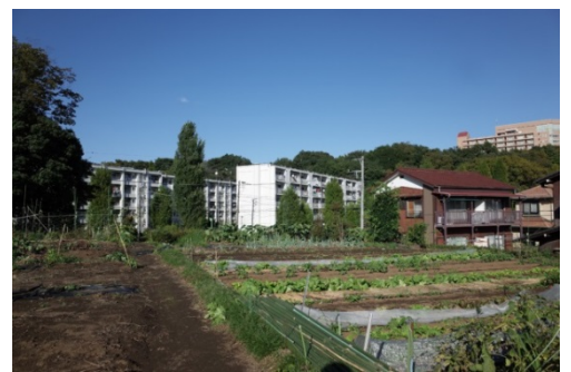
近隣の農地の様子。今後、地域の野菜をタガヤセ大蔵で料理したり、子どもたちが収穫することができれば地域の価値となる。