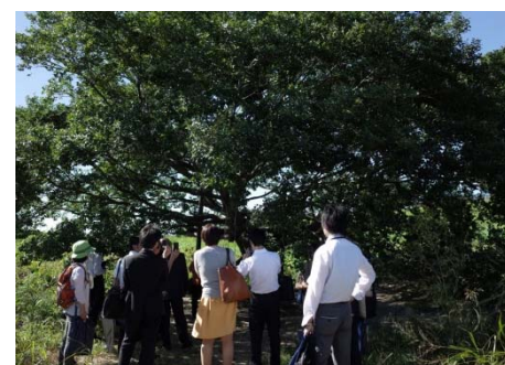
せたがや水辺の楽校はらっぱ