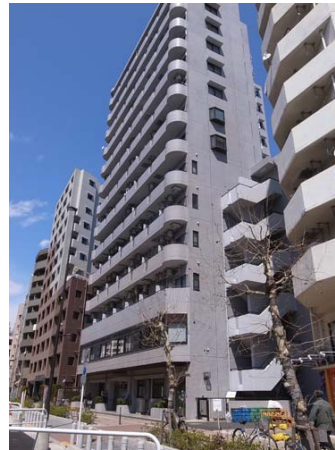
共同住宅の 2 階が CH 巣鴨