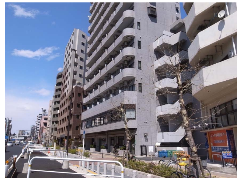
コレクティブハウス巣鴨(外観)

【コレクティブハウスとは】独立した住戸と共用のリビングルームやキッチンを併せ持つ共同住宅で、食事や家事などを居住者が協働で行うというコミュニケーション豊かな生活スタイルが注目を集めています。(以下、CHと表記)