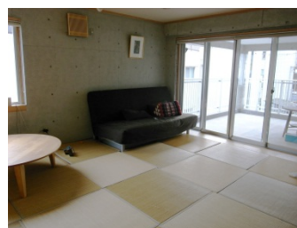
畳のコモンスペース