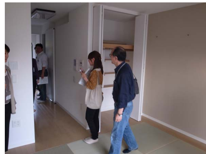
従前居住者用賃貸住宅の内部見学の様子