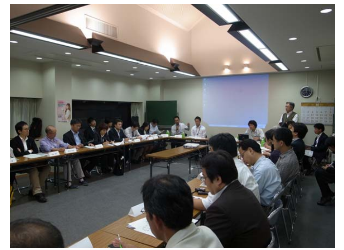
台東区とURから事業についての説明があり、その後活発な意見交換がなされました。