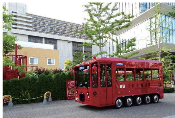
4つの公園を巡回する IKEBUS