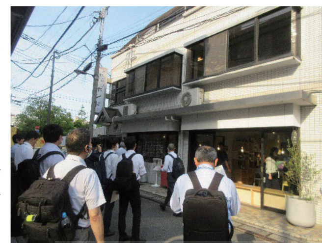
現地視察の様子(ひがいけポンド)

ひがいけポンドの一番の価値はコミュニティであると考えている。多層的なコミュニティがあり、それを我々運営者を中心とした同心円に例えると、我々運営者の周りにメンバーシップ、さらにその周りに単発出店者とポップアップラボというオンラインコミュニティ（出店者、出店希望者の横のつながり）、ポンドクラブというサポータークラブ、コミュニティの縁側として Cleanup&Coffee Club (CCC) という団体がある。CCC は、月 1 回、日曜日の朝にゴミ拾いをした後にコーヒーを飲んで雑談するというシンプルなイベントだが人気があり、今では豊島区内 6 か所、埼玉、千葉などにものれん分けし、豊島区の若者の居場所応援事業にも採択された。ポンドクラブは、ひがいけポンドの困りごとに対して、有志のメンバーが不定期で参加するというサポータークラブである。出店するのは勇気があるがお客さんとして来るだけでは物足りない、何らかの形でひがいけポンドに関わりたいたいという熱意をいろいろな人から感じていて、その受け皿として作った。