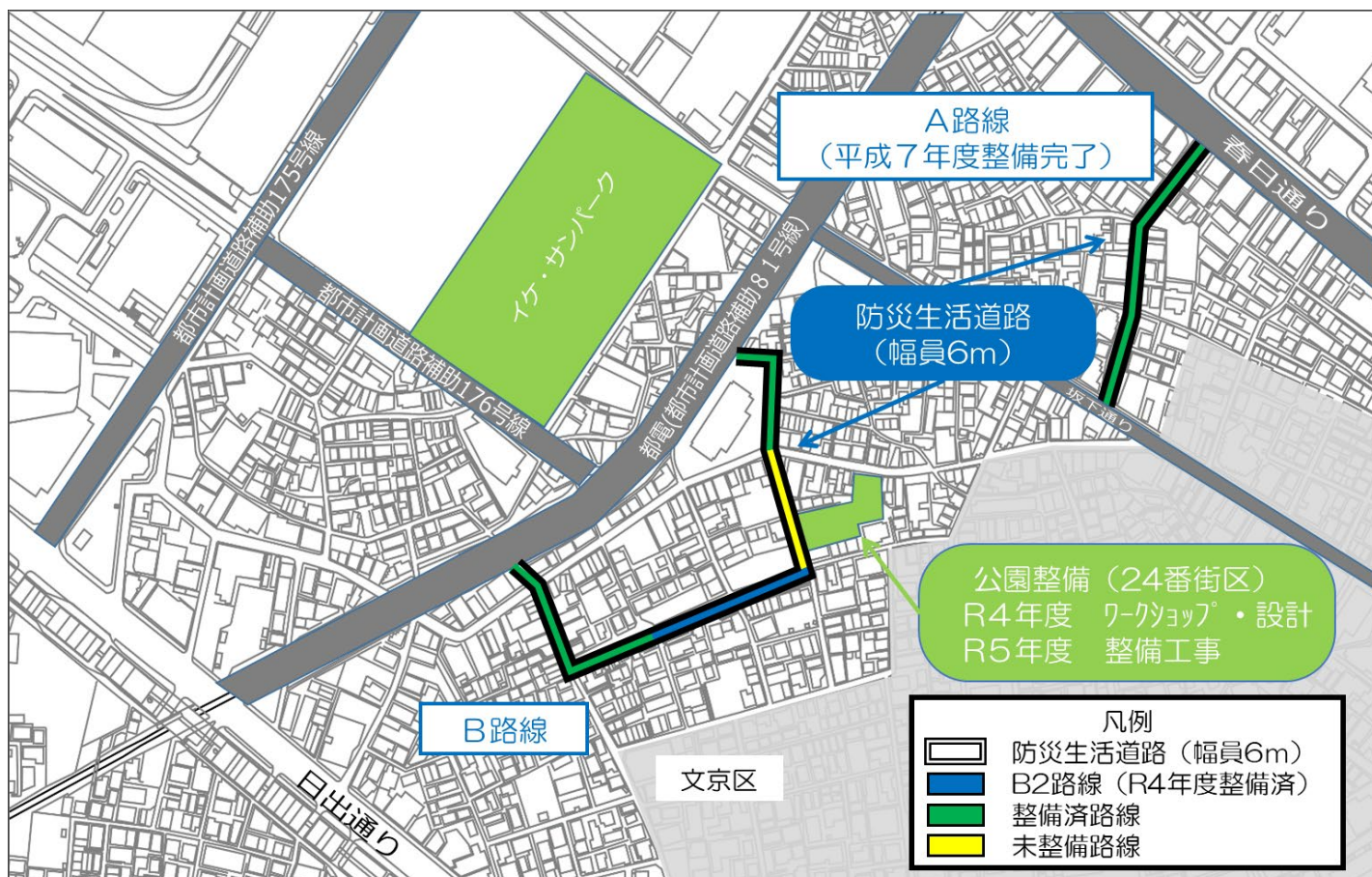
「地区の基盤整備」防災生活道路