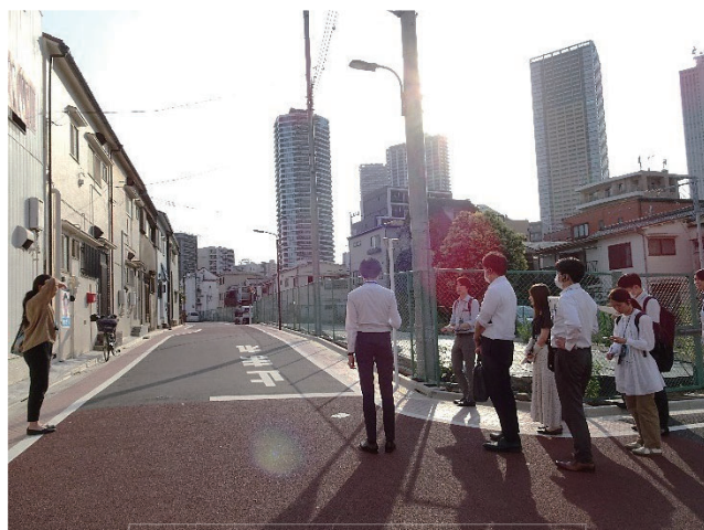
現地視察の様子(防災生活道路)