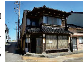
移住体験施設ほうじょうづ

NPO法人水辺のまち新湊 ：内川の魅力発信イベント開催、リノベーションによる民泊施設・カフェ（番屋カフェ）の取組み、空家バンク・おくりいえ等の取組み グリーンノートレーベル株式会社 ：リノベーションによるカフェ（uchikawa六角堂）や宿泊施設の整備・運営、店舗としての再生など地域の場づくり支援