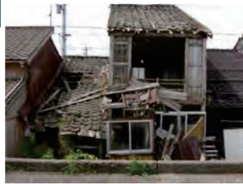
事業実施前の老朽家屋

● 事業の背景と内容 老朽木造建築物は一度空き家になると風雪による傷みが加速し、倒壊や火災の危険もあった。重点密集市街地の公表を機に、平成18年に防災まちづくり勉強会が設立、平成21年までの4年間で将来の方向性を検討する勉強会や住民意向調査などを行った。地区の整備目標の基本方針を「 多世代が住み続けるまち放生津 」と定め、安全で安心なまちづくりの推進と共に、多様な世代が住み続けられ、地区の活力を取り戻すことを志願として、老朽建築物の除却、道路整備、共同住宅の建設、敷地整序などによって地区に人を呼び戻す方策として住市総と区画整理を組合わせて事業を実施している。