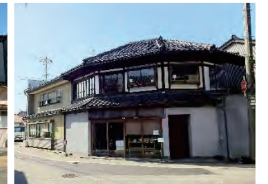
カフェ uchikawa 六角堂