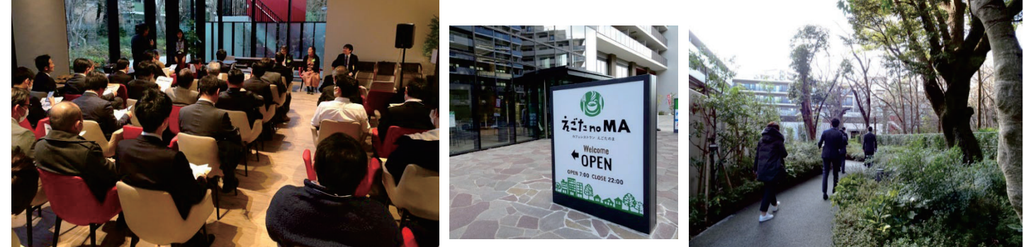
えごたいえのフリースペース 地域に開放された憩いの交流スペース。イベント会場にもなる。 江古田の杜の保存樹木と散策路 住民参加による緑の維持管理を行っている。

キッズスペースもりのいえ 子育て世代、働く親たちへのサポートがまちの魅力や価値を生み出し、持続性のあるまちづくりへつながっていく。