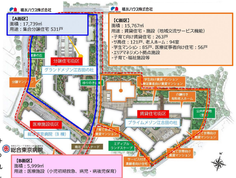
土地利用計画図(H30.10 時点)