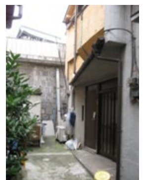
整備前: 崖地にぶつかり行き止まりになった通路

若葉3-2地区: 当初の共同建替えモデル地区の1つ。事業が難航し区域を縮小して実現したが、後に隣接地区への共同建替えの連鎖につながった。