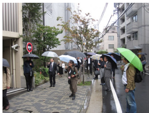
まちづくりルールに則った共同建替えにより確保された歩道状空地