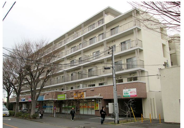
ココファン柏豊四季台：拠点型サ高住（小規模多機能、グループホーム、24H訪問介護・看護、居宅介護、在宅療養支援診療所、地域包括支援センター他）2014.5 開設