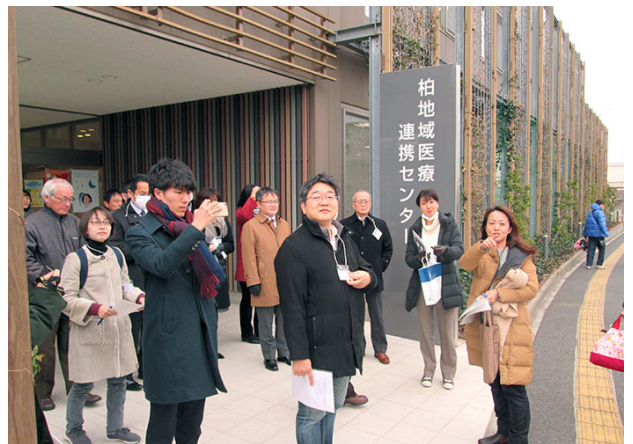
柏地域医療連携センター：豊四季台団地の中央に位置し、柏市の福祉・医療部門、医師会、歯科医師会、薬剤師会、事務局がある中心施設。2014.4 開設