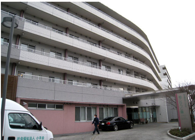
柏こひつじ園：特別養護老人ホーム、ショートステイ、グループホーム、デイサービスの施設にティーサロンを併設。生きがい就労のシニアスタッフを受け入れている。2011.3 開設