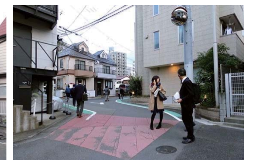
三太通り(クランク改良):拡幅され見通しも良くなった整備後のクランク部分