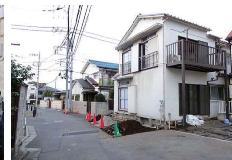
三太通り(拡幅整備):広域避難場所への避難路として拡幅が進んでいる