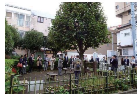
トンプオ広場:町内のクラブが管理しているポケットパークの第1号