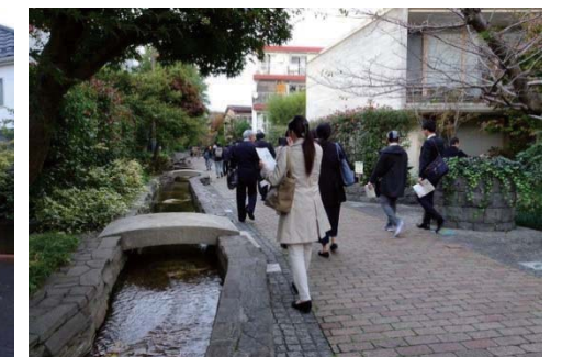
烏山川緑道:暗渠化された河川上部をせせらぎのある緑道として再生