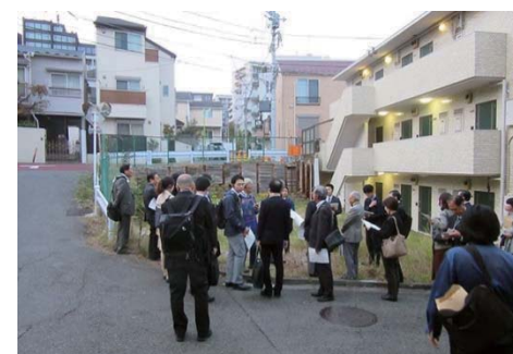
三太通り(重点交差点改良):改良工事予定の高低差が大きいクランク箇所