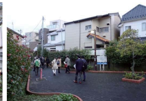
てんとうむし広場:行き止まりの解消を兼ねて整備されたポケットパーク