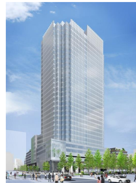
JR四ツ谷駅から見た完成予想パース

平成27年3月に権利者の皆様にご説明した「実施設計概要・権利変換手続きに係る説明会」時点から、本体工事着工をした現時点において変更となっている点や、デザインコンセプト、最新パースなどをご紹介します。