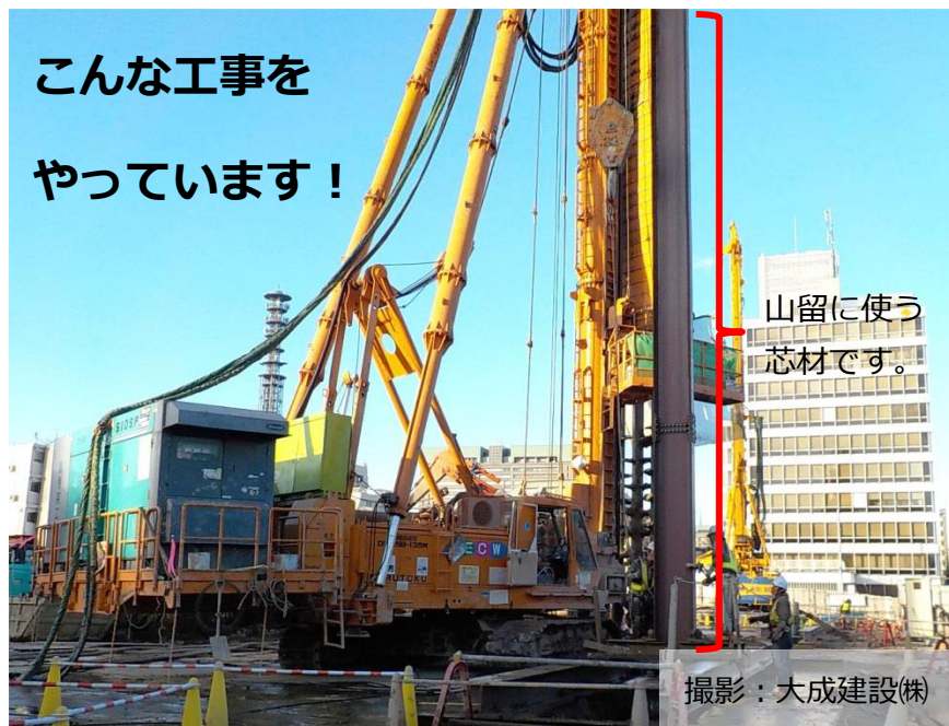
山留に使う 芯材です。