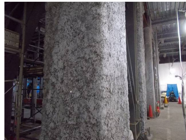
※耐火被覆(半乾式ロックウール)吹付け作業後の柱