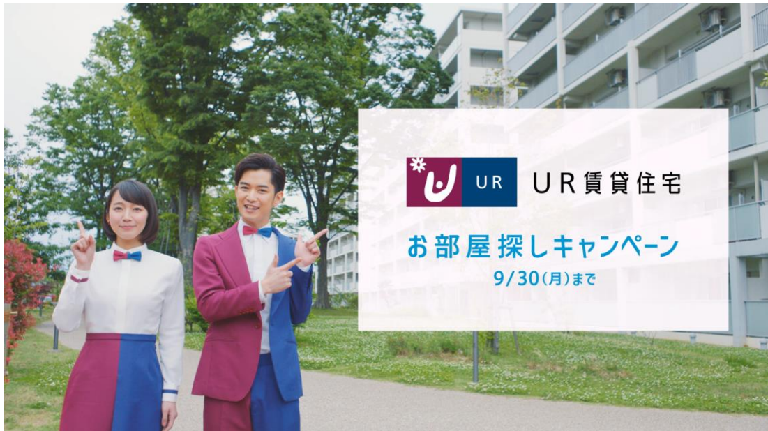
新TV-CM「小さなまち」篇より

UR賃貸住宅TV-CMとしては初のドローン撮影を行い、URが推進する「豊かな屋外環境」や「周辺環境」を、空撮映像を交えながら紹介していきます。