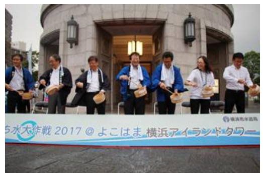
【昨年の打ち水の様子】

※取材をご希望の方は、8月7日（火）までに別添申込書に必要事項をご記入の上、FAXにてご連絡ください。