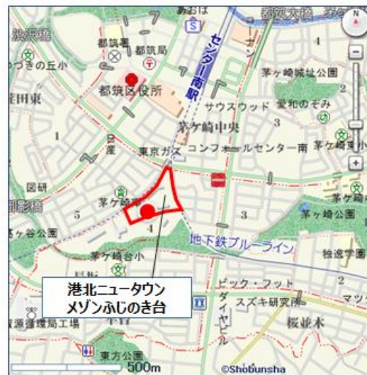
「地図使用承認©昭文社第56G107号」