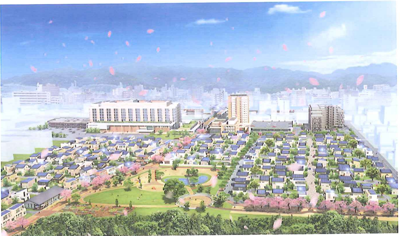
BONJONOまちのイメージパース図