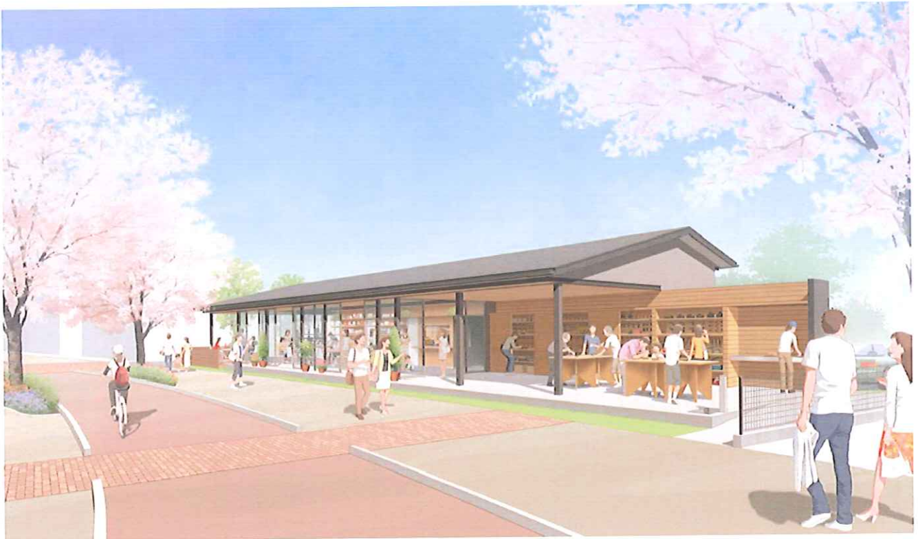
BONJONO集会施設「城野くらしの製作所 TETTE(テッテ)」イメージパース図