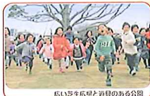
広い芝生広場と遊具のある公園

まちのみんなで花や野菜を育てることができる家庭ではできない専門的なベジタブルガーデンスペースです。ここでできた野菜は収穫して、バーベキュー等で仲間たちと一緒に楽しむことができます。