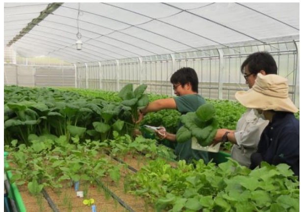
〔日の里ファーム内の収穫の様子〕

お問い合わせは下記へお願いします。 独立行政法人都市再生機構九州支社 住宅経営部 ストック再編事業チーム （電話）092-722-1045 総務部 総務チーム （電話）092-722-1004