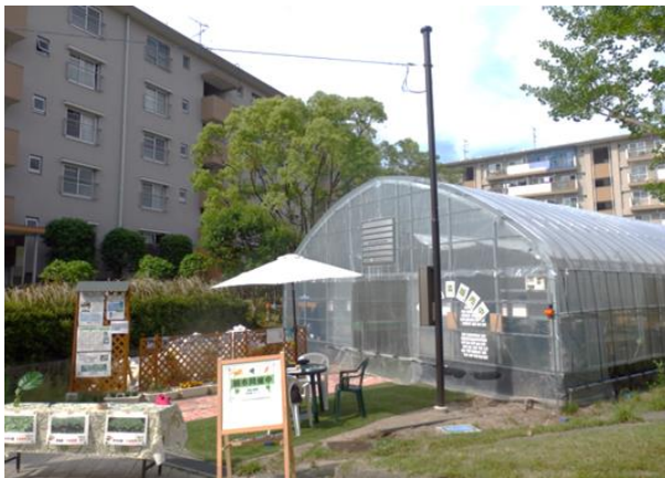
〔団地の農場 日の里ファーム外観〕

この度、宗像市や日の里地区にお住まいの皆様、関係者の皆様と連携して、 6 月 19 日（日）に「団地の農場 日の里ファーム」のオープニングイベント（別添 2 参照）を開催し、以後、会員組織「日の里ファームクラブ」による野菜栽培を本格始動いたします。