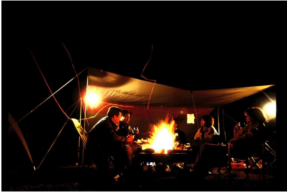
(団地 de キャンプ イメージ)