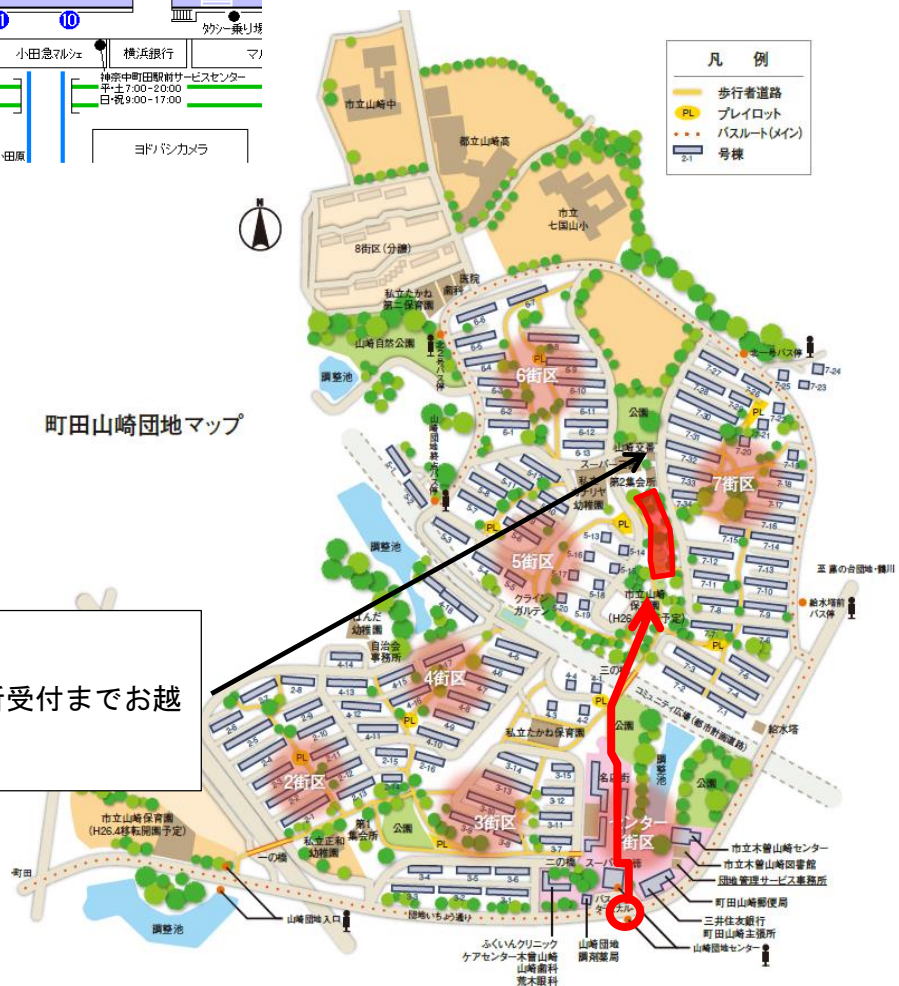
町田山崎団地マップ

小田急小田原線・JR 横浜線「町田」駅 バス 15 分 (バス乗り場④⑤) JR 横浜線「古淵」駅バス 10 分 いずれも「山崎団地センター」下車