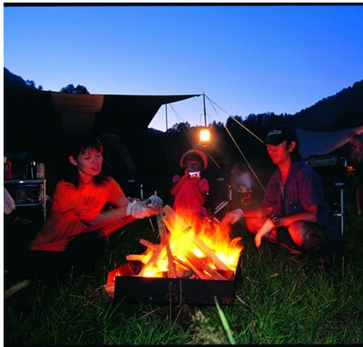
「団地 de キャンプ」イメージ

つきましては、DANCHI Caravan 初日にイベントの様子をご案内させていただきます。お忙しいところ恐縮ではございますが、是非現地まで足をお運び頂きますようお願い申し上げます。