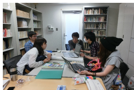
ハイブリッドメディア研究会 企画・編集会議の様子

多摩ニュータウン地域を中心とした地域の情報を地域内外に発信し、地域活性化につなげていくとともに、取材を通じて地域との連携を深め、コミュニケーション力、地域が抱える問題への気づきなど実践的な学習の機会としていきます。