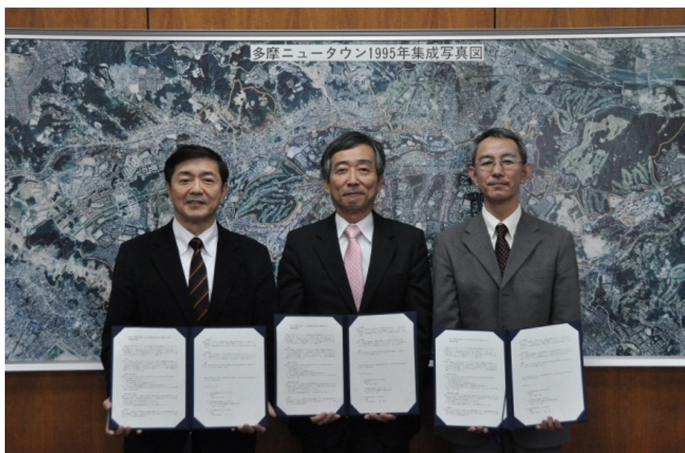
多摩大学久恒啓一経営情報学部長(左)と多摩市永尾副市長(中)とUR都市機構坂口多摩エリア経営部長(右)

多摩大学、多摩市並びに独立行政法人都市再生機構東日本賃貸住宅本部(以下「UR都市機構」)は、多摩大学に在学する学生のUR賃貸住宅への居住促進により、多摩地域の活性化及びその担い手の育成という地域の課題の解決を推進するため相互に連携・協力することに合意し、多摩市役所にて平成 27 年 2 月 24 日(火)に連携協定書を締結いたしました。