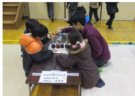
移動児童館でのボランティアの様子

こうした活動を通じて、地域の「お兄さん、お姉さん」として、子供たちの安全・安心の確保と健やかな成長に貢献していきます。