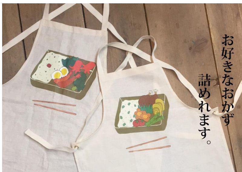
親子ワークショップメニュー「親子おそろいお弁当バイキングエプロンづくり」

親子での参加者を対象としたワークショップとして、「親子おそろいお弁当バイキングエプロンづくり（先着40組）」「親子おそろい箸をつくろう（先着20組）」を開催します。