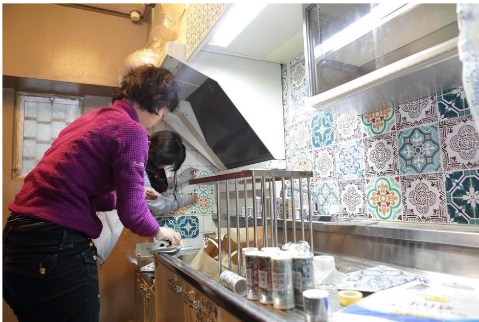
昨年度高島平団地にて実施された DIY 施工風景

つきましては、開催日においてイベントの様子をご案内させていただきます。お忙しいところ恐縮ではございますが、是非現地まで足をお運び頂きますようお願い申し上げます。