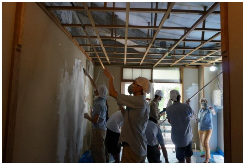
西日本支社UR職員による施工風景

高島平団地 2-26-3 号棟の集会所を、UR職員自らの DIY によって改修していきます。当日はワークショッププログラムの参加者などの飛び込み参加も大歓迎です。なお、2月23日(火)にもUR-D I Y部と夏水組(一部一般参加者含む)で事前ワークショップを行います。